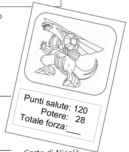
Carta di Nicolò