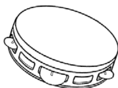
Tamburello a sonagli