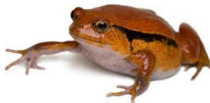
Rana della specie Microhylidae

Al termine del Cenozoico nelle savane dell'Africa comparvero gli ominidi.