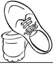
Le scarpe nuove.

Gli aggettivi qualificativi sono parole che ci danno informazioni sulla qualità delle cose, delle persone o degli animali.