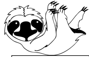
Il bradipo lento.

Si trovano, quindi, insieme ai nomi e devono "andare d'accordo" con essi nel genere (maschile o femminile) e nel numero (singolare o plurale).