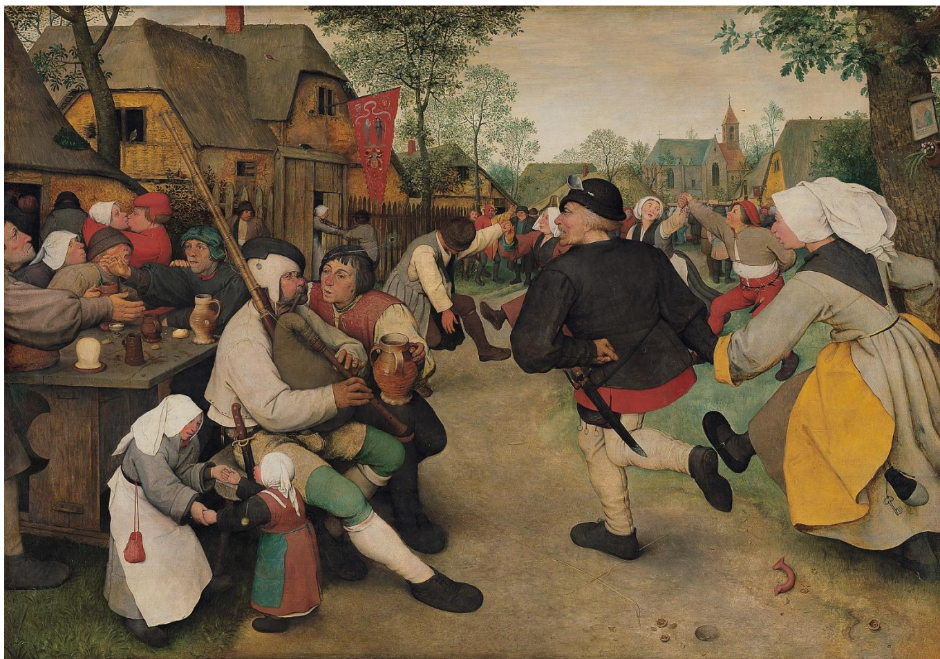
Pieter Bruegel il Vecchio, Danza di contadini