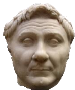
1 Gneo Pompeo

A. Abbina ogni personaggio alla sua descrizione.