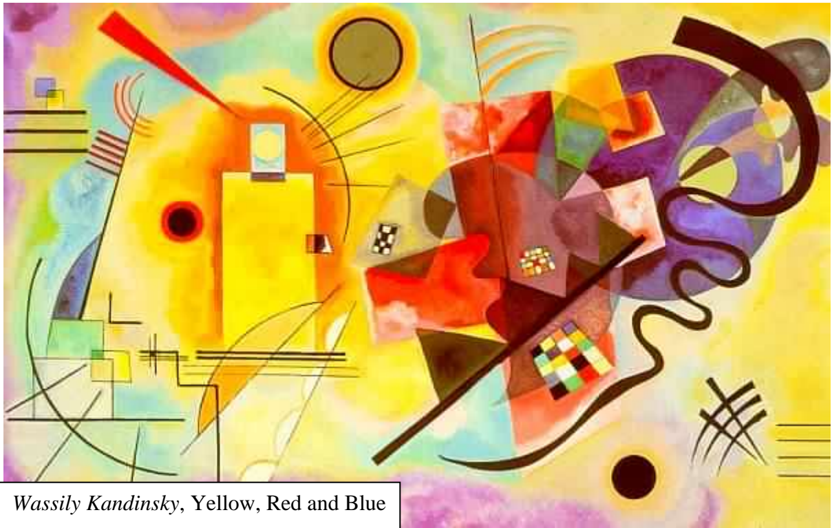
Wassily Kandinsky, Yellow, Red and Blue