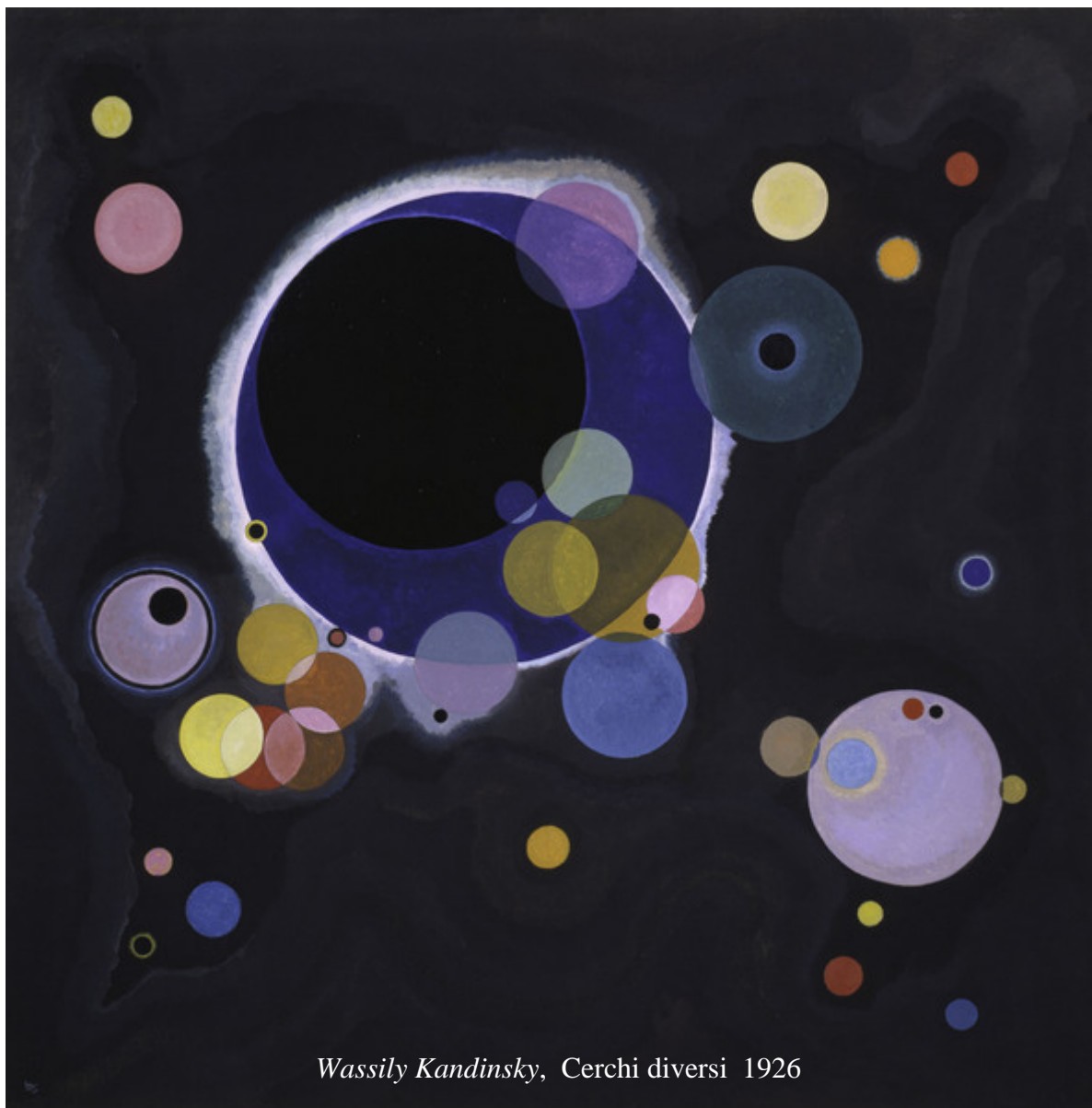
Wassily Kandinsky, Cerchi diversi 1926