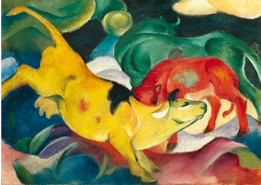
Franz Marc – Mucche rossa, verde e gialla.