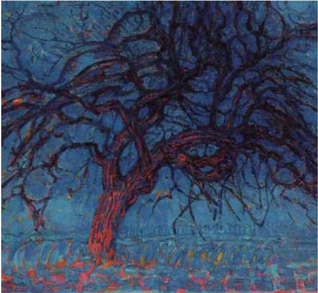
Piet Mondrian – Albero rosso - 1908