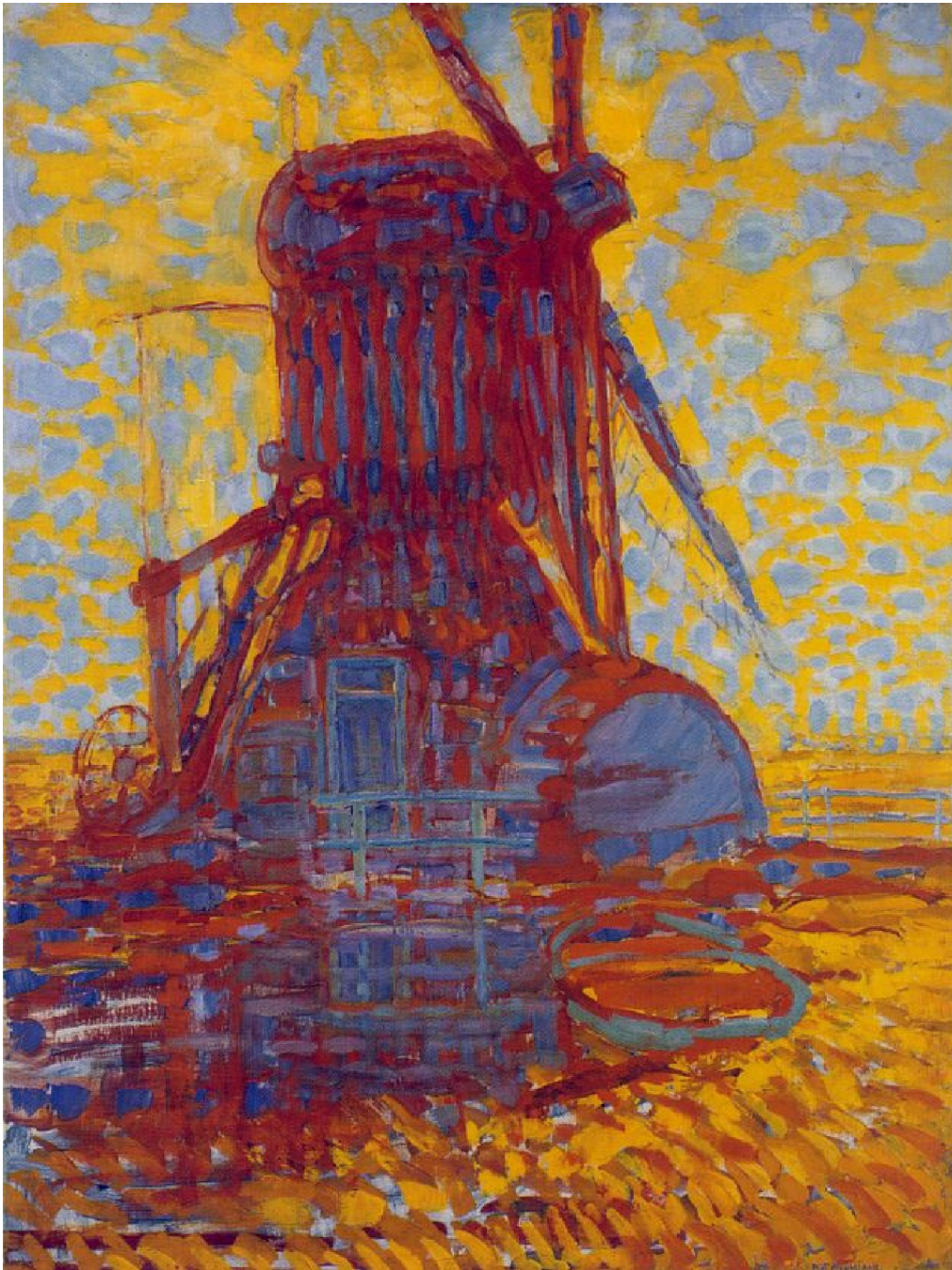
Piet Mondrian - Mulino alla luce del sole – 1908

Piet Mondrian (vero nome Pieter Cornelis Mondriaan) (Amersfoort, 7 marzo 1872 – New York, 1 febbraio 1944) è stato un pittore olandese, importante esponente del movimento artistico De Stijl. (in olandese significa "Lo Stile") che comprendeva un gruppo di artisti e architetti che diedero vita al neoplasticismo.